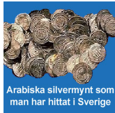
Arabiska silvermynt som man har hittat i Sverige

Nordborna hade mycket bra skepp och de seglade långt. De kom till Grönland och Nordamerika i väster. De seglade på floderna i Ryssland till Kaspiska havet, Svarta havet och Konstantinopel (Istanbul) i öster. De besökte Bagdad och platser ännu längre bort.