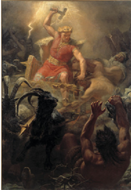
Tors strid med jättarna av E. M. Winge 1872.

Tiden i Norden för 100-150 år sedan kallas för nationalromantiken. Ordet nation betyder land. Under nationalromantiken var många människor extra stolta över sitt lands historia , men de berättade bara de delar från historien som de tyckte om.