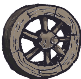
Ett hjul till en vagn