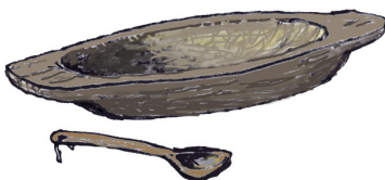
Ett tråg och en träsked