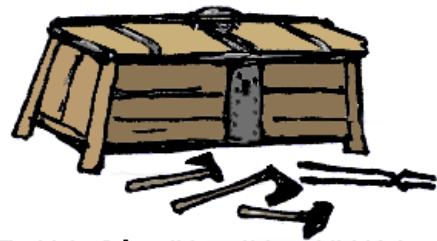
En kista från vikingatiden. Vid kistan ligger några verktyg.

1936 hittade man en kista från vikingatiden på Gotland. Den låg i en gammal sjö som heter Mästermyr. I kistan fanns nästan 200 olika verktyg . Många av verktygen ser mycket moderna ut. Nu finns kistan på Historiska museet. I montrarna bredvid kistan kan man se verktygen som låg i den.