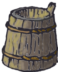
Ett laggkärl, en hink av trä