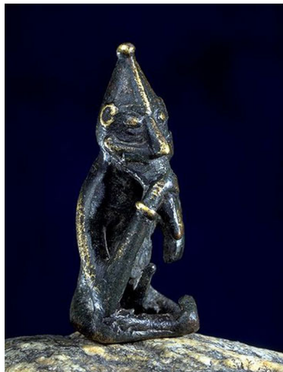
Liten figur av guden Frej

I norra Norden levde människor som inte var jordbrukare utan levde av jakt och djurskötsel . De hade en annan religion. De norra delarna av Norden blev inte kristna förrän långt efter vikingatiden.