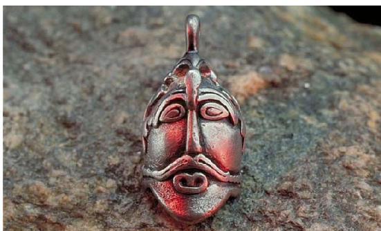
Vikingatida hängsmycke med mansansikte